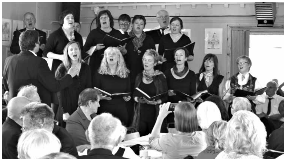
Koret synger på kirkekaffen