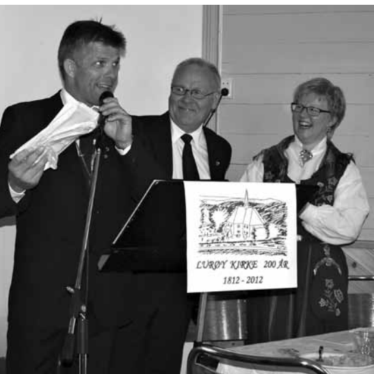
God stemning under kirkekaffen.