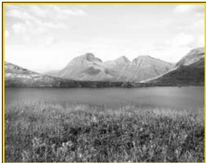
Kvannskaret er et naturskjønt område.