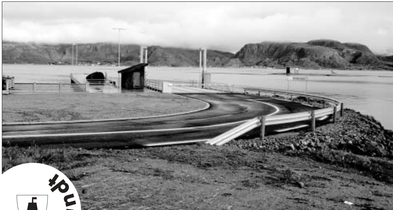
Kvarøy fergeleie tatt i bruk