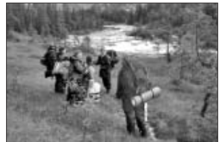
Jentene vil anbefale andre å dra på personaltur til Lille Helgåvatnet.