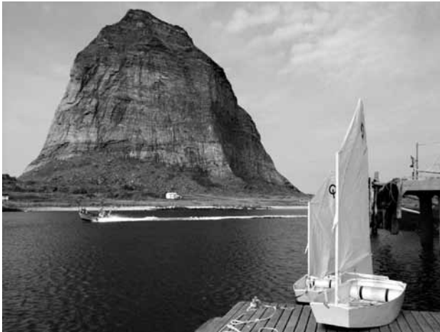
➔ Seiling Sanna.