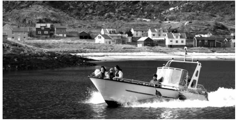
Fridykkergruppa Sanna.