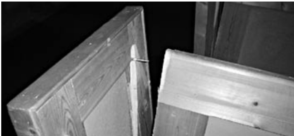
Slik gikk det med benkene da Narve herjet med kirka!